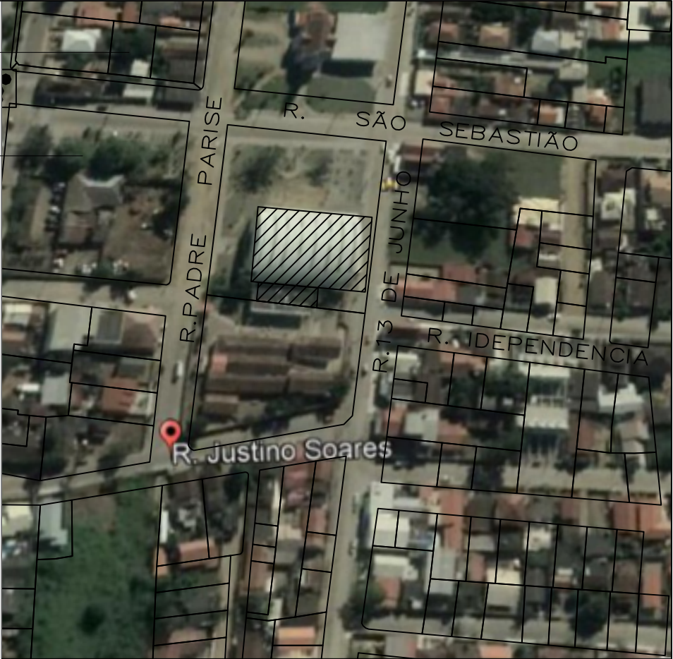
PLANTA DE SITUAÇÃO ESCALA 1 : 1000