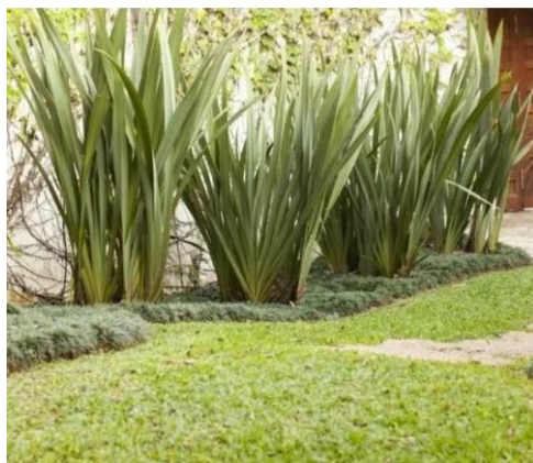
-Fórmio Verde, de 1 m de altura.