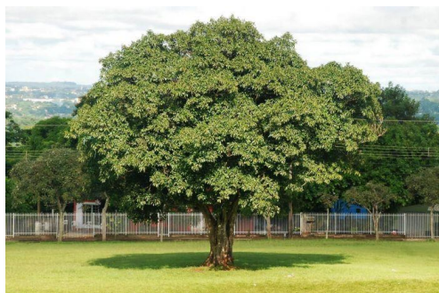
- Oiti, Altura mínima de 2 m.