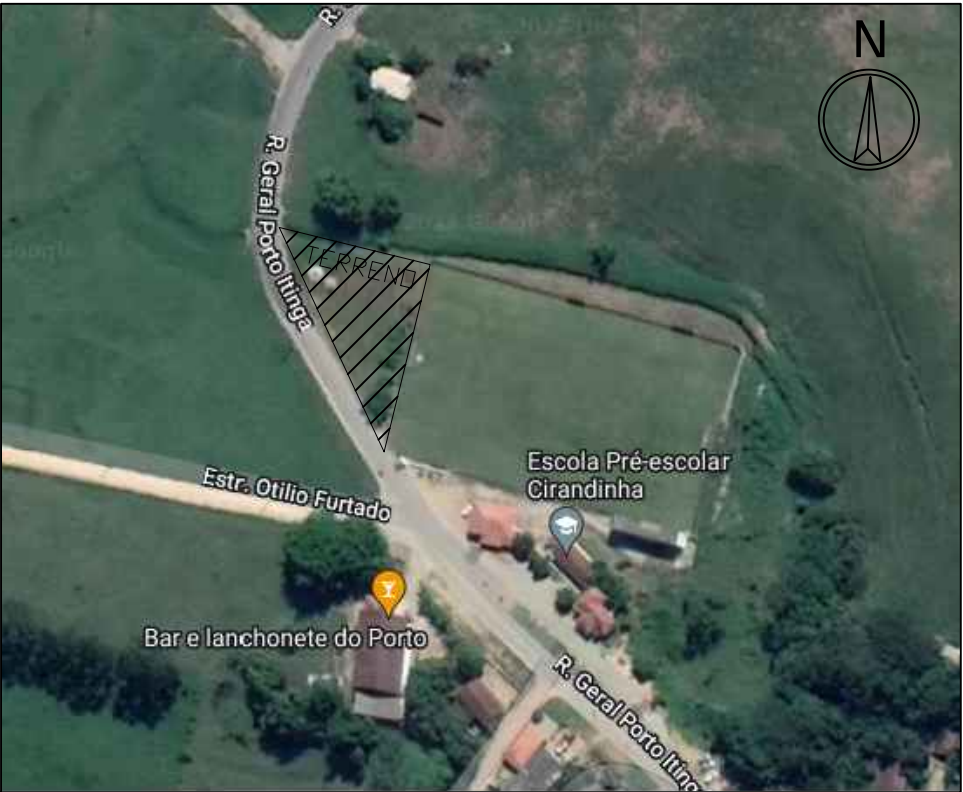
LOCALIZAÇÃO sem escala